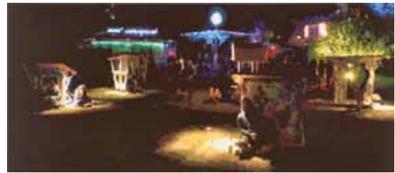
RÖMER + RÖMER: Chill Out zur Geisterstunde (2015) | 70 x 160 cm | Öl auf Leinwand | © RÖMER + RÖMER, Courtesy Galerie Michael Schultz / Foto: Eric Tschernow