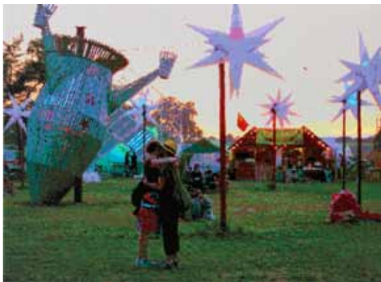
RÖMER + RÖMER: Sputnik (2015) | 110 x 150 cm | Öl auf Leinwand