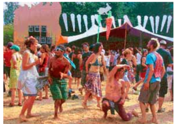
RÖMER + RÖMER: Tanz auf der Seebühne (2015) | 110 x 150 cm | Öl auf Leinwand