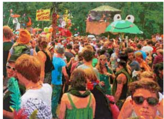
RÖMER + RÖMER: Wo ist eigentlich GESTERN? (2015) | 110 x 150 cm | Öl auf Leinwand | © RÖMER + RÖMER, Courtesy Galerie Michael Schultz / Foto: Eric Tschernow