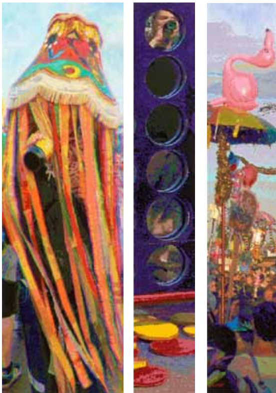
links: RÖMER + RÖMER: Schaumwein-Leuchtkörper (2015) | 290 x 90 cm | Öl auf Leinwand | © RÖMER + RÖMER, Courtesy Galerie Michael Schultz / Foto: Eric Tschernow