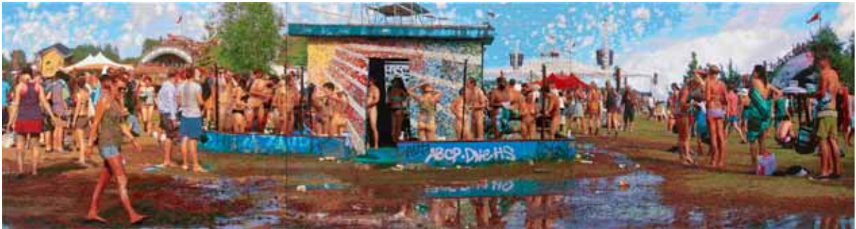
RÖMER + RÖMER: Shower Tower Oase (2014) | 200 x 750 cm (Triptychon) | Öl auf Leinwand | © RÖMER + RÖMER, Courtesy Galerie Michael Schultz / Foto: Eric Tschernow

Folgende Pressebilder stellen wir auf Anfrage zur nicht-kommerziellen Verwendung im Rahmen einer aktuellen redaktionellen Berichterstattung über RÖMER + RÖMER und ihre Ausstellung „Wo ist eigentlich GESTERN?“ sowie unter Angabe der Credits honorarfrei zur Verfügung. Weitere Motive und Bildformate auf Anfrage.