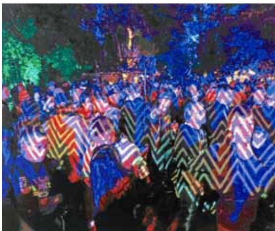
RÖMER + RÖMER: Party Sträflinge (2014) | 200 x 250 cm | Öl auf Leinwand | © RÖMER + RÖMER, Courtesy Galerie Michael Schultz / Foto: Eric Tschernow