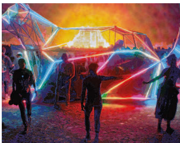
Römer + Römer, Black Rock Bandits Raccoon , 2018, Öl, Acryl auf Lwd, 230 x 300 cm

Die Römers besuchten Burning Man 2017 und hielten ihre Eindrücke in vielen digitalen Fotografien fest. Eine Auswahl an ausdrucksstarken Szenen wurde im Computer weiterverarbeitet, bis die digitale Vorlage anschließend mit Öl und Acryl in die häufig großformative Malerei übertragen werden kann.